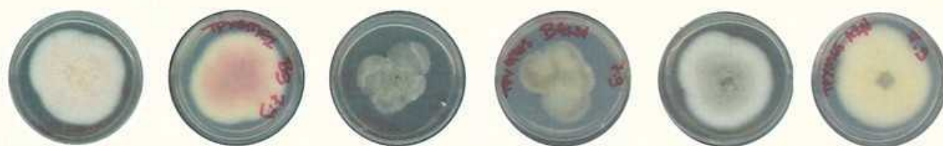
Εικόνα 2. Διαφορετικοί μορφότυποι του γλοιοσπορίου ( Colletotrichum acutatum ).