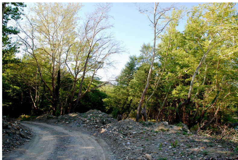
Μετάδοση της ασθένειας με μολυσμένα εργαλεία (αριστερά) και με μολυσμένα μηχανήματα εκσκαφής - χωματουργικά (επάνω).

Το Μεταχρωματικό Έλκος του Πλατάνου είναι η πιο καταστρεπτική ασθένεια των δέντρων της Ελλάδας που βρίσκεται σε εξέλιξη αυτή τη στιγμή στη χώρα μας. Εάν δεν ληφθούν δραστικά μέτρα πρόληψης και αντιμετώπισης της αρρώστιας, θα δούμε να πεθαίνουν πάρα πολλά από τα πολύ όμορφα και σημαντικά δένδρα Πλατάνου στα χωριά και τις πλατείες μας, ενώ στις πηγές και στα ποτάμια μας τα νεκρά δέντρα θα αριθμούνται σε χιλιάδες.