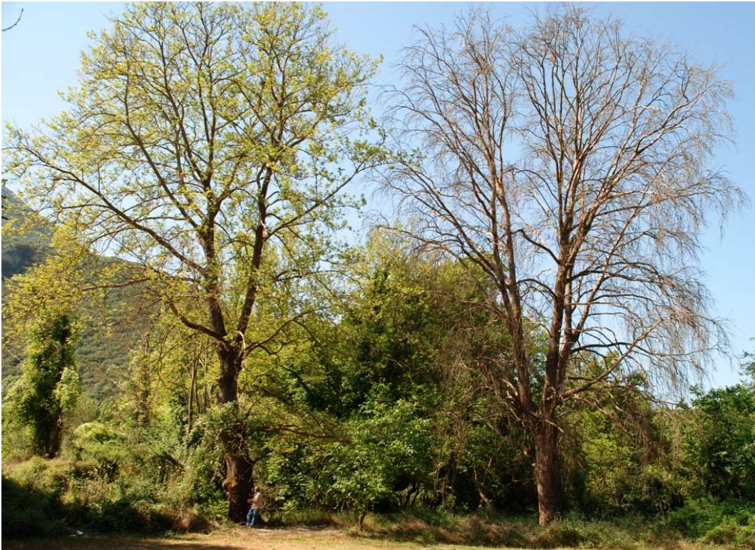
Προσβεβλημένο & νεκρό από την ασθένεια Πλατάνια

φάρμακο ή ίαση για την ασθένεια αυτή. Ο μόνος τρόπος να την περιορίσουμε και να την καθυστερήσουμε, ο μόνος τρόπος να διατηρήσουμε τα Πλατάνια μας, είναι η πρόληψη.