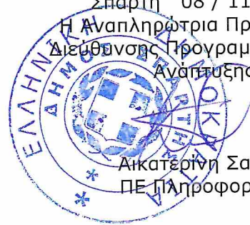
Αικατερίνη Σανιδά ΠΕ Πληροφορικής

ΘΕΩΡΗΘΗΚΕ Σπάρτη 08 / 11 / 2022 Η Αναπληρώτρια Προϊσταμένη Διεύθυνσης Προγραμματισμού & Ανάπτυξης