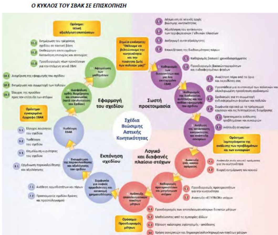
Σχήμα 1: Τα ένδεκα (11) βήματα του κύκλου ΣΒΑΚ

Οι κατευθυντήριες οδηγίες της Ε.Ε. για την προετοιμασία και ανάπτυξη ενός ΣΒΑΚ περιλαμβάνουν ένδεκα (11) βήματα και τριάντα δύο (32) δραστηριότητες οι οποίες θεωρούνται μέρος ενός κύκλου σχεδιασμού και μιας διαδικασίας συνεχούς βελτίωσης.