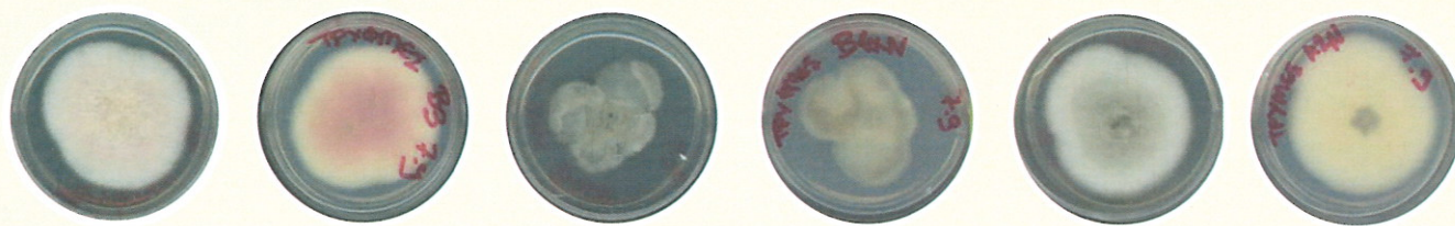
Εικόνα 2. Διαφορετικοί μορφότυποι του γλοιοσπορίου ( Colletotrichum acutatum ).