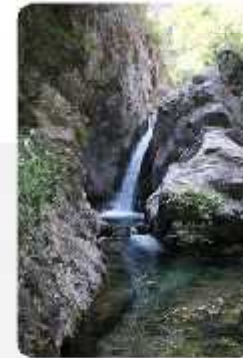
Φύση: Δραστηριότητες, Διαδρομές, Πάρωννας, Ταΰγετος